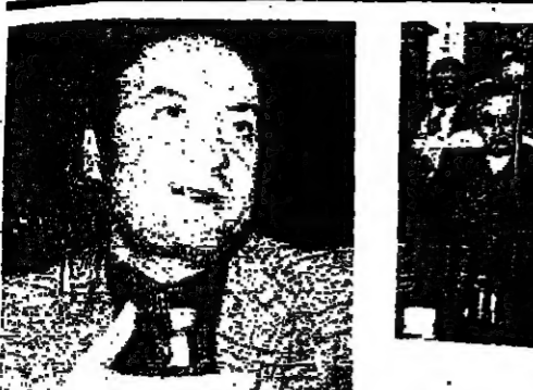
مقدمة المصنوع